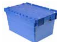
K.1.SERVICE/IMOPLT Servicebox imop Lite