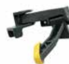
K.1.S.115.0307.357 Kör- och parkering- sassistans