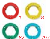
K.2.S.115.1058.1 Skåp för borste HACCP färgkodad